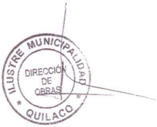
CUADRO EVALUACION LICITACION PUBLICA " ESTUDIOS PARA SANEAMIENTOS SANITARIOS LOCALIDADES DE CAMPAMENTO Y LA ORILLA".