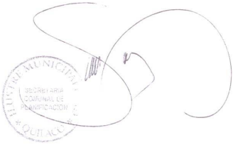
CUADRO EVALUACION LICITACION PUBLICA " CONSTRUCCION GRADERIAS Y CIERRE PERIMETRAL CANCHA LA ORILLA"