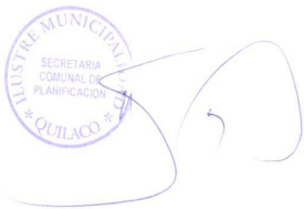
CUADRO EVALUACION LICITACION PUBLICA "ESTUDIO FUSION ESCUELA F-1093 QUILACO Y LICEO FJM QUILACO"