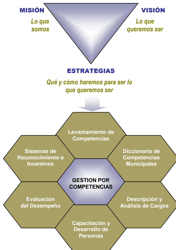
Figura 3. Diagrama de la Subprocesos de Administración de Recursos Humanos por Competencias.

Para comenzar, es necesario comprender que un sistema de gestión por competencias no sólo implica levantar las competencias necesarias para cada cargo, sino que requiere del reordenamiento del sistema de gestión municipal actual. El modelo propuesto se grafica en la Figura 3.