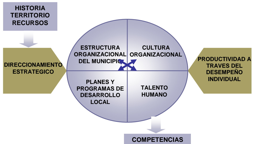
Figura 2. Diagrama de la Gestión por Competencias en Municipios.

La competitividad, ya sea entre municipios o en comparación con el propio desempeño (ámbito individual), exige diferenciarse.