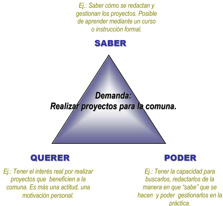
Figura 1. Ejemplo de Competencia.

Las competencias abarcan los conocimientos (saber), actitudes (querer) y habilidades (poder) de un individuo (ver ejemplo de la Figura 1).